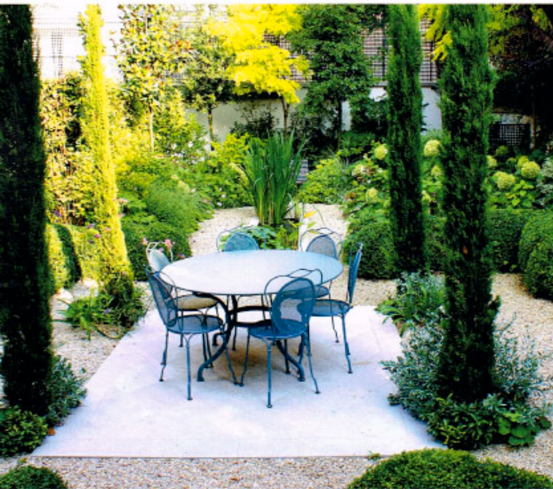
Der Unvollendete: Wie zufällig und doch durchdacht wirkt de Chiracs Gartengestaltung